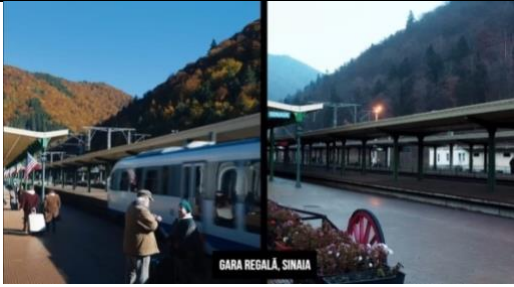
Stasiun Sinaia (Netflix vs Realita)

jalur lalu lintas keluarga Raja Mihai I untuk menuju Kastil Peles (Lovin' Romania, 2021) (Lovin' Romania, 2021). Dalam serial Wednesday , stasiun Gara Regala muncul dalam episode dua “Who is the Loneliest Number” dan diberi nama Burlington Station . Pada episode tersebut, stasiun Gara Regala divisualisasikan sebagai stasiun yang berada pada desa yang indah. Dalam hal tersebut, Netflix tidak menambahkan properti atau CGI tertentu pada scene yang menampilkan stasiun Gara Regala. Kesan asri dan indah merupakan gambaran asli dari wilayah Sinaia (Bopping, 2022).