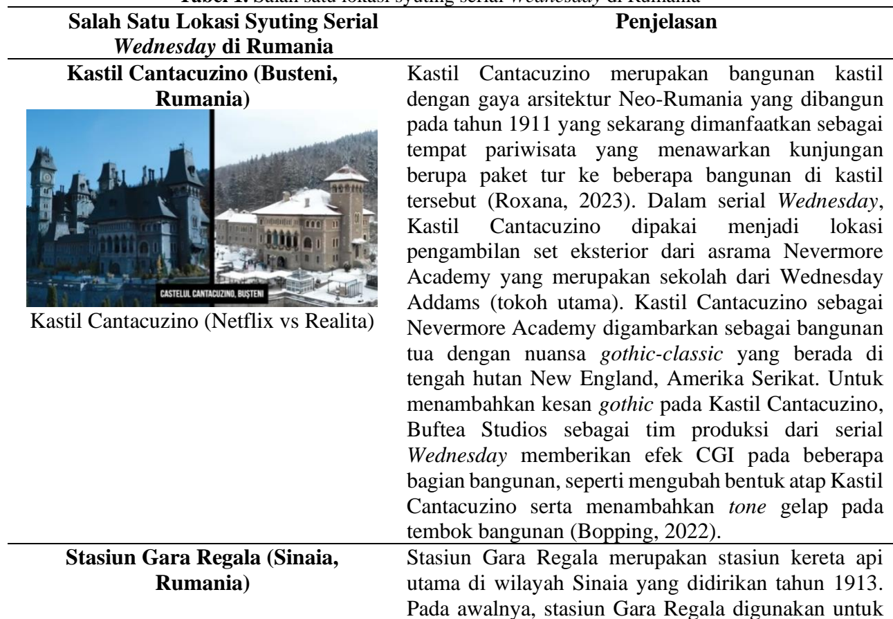
Tabel 1. Salah satu lokasi syuting serial Wednesday di Rumania

Dalam serial Wednesday , Rumania dipilih menjadi lokasi syuting karena memiliki sejumlah bangunan dengan ciri khas arsitektur yang unik. Dalam wawancara dengan Little Black Book , David Minkowski sebagai co-executive producer menyebutkan bahwa Tim Burton sebagai salah satu sutradara serial Wednesday menilai bahwa Rumania memiliki elemen gothic pada beberapa bangunan kastilnya, sehingga langsung dipilih menjadi set utama lokasi syuting serial tersebut. Lebih lanjut, Tim Burton menyebutkan bahwa nuansa gothic yang dimiliki Rumania sesuai dengan suasana dan genre dari serial Wednesday (Little Black Book, 2022). Di bawah ini merupakan tabel yang memuat contoh tempat di Rumania yang dipilih menjadi lokasi syuting serial Wednesday .