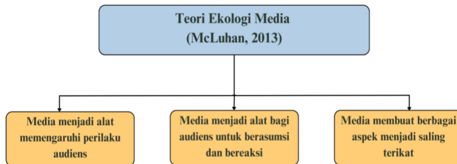
Gambar 2. Kerangka Sintesa Pemikiran Teori Ekologi Media

menjadi alat menyatukan beberapa aspek menjadi saling terikat. Hal ini berkaitan dengan media teknologi yang membuat dunia semakin borderless dan tidak terpisah. Konsep saling terikat juga sejalan dengan menyatukan beberapa aspek yang saling bertolak belakang agar menjadi satu oleh media (McLuhan, 2013).